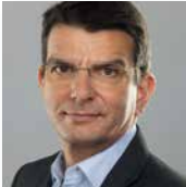
Harald Schützeichel © Harald Schützeichel