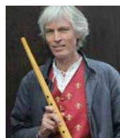
Ian Harrison

Der Zink ist ein historisches Blasinstrument, das seine Blütezeit im 17. Jahrhundert hatte. Klanglich nimmt man eine Mischung aus Blockflöte und Trompete wahr.