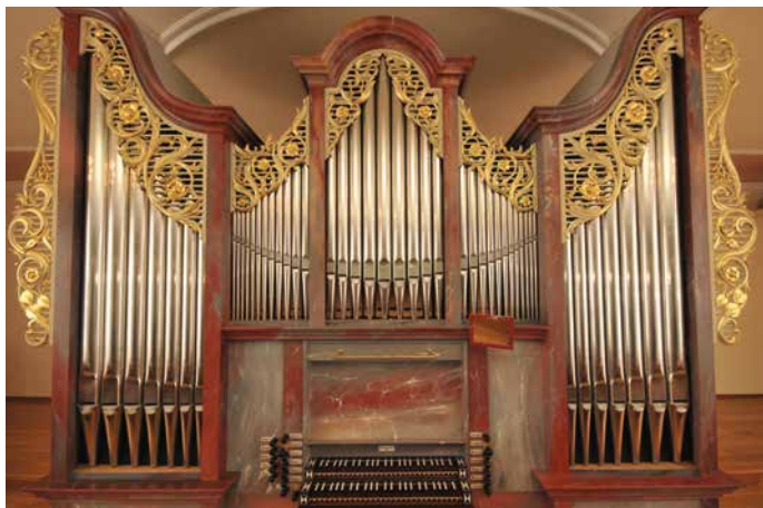
Ahrend-Organ Wallfahrtskirche Maria Lindenberg