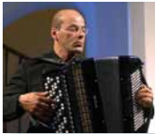
Teodoro Anzellotti © Teodoro Anzellotti