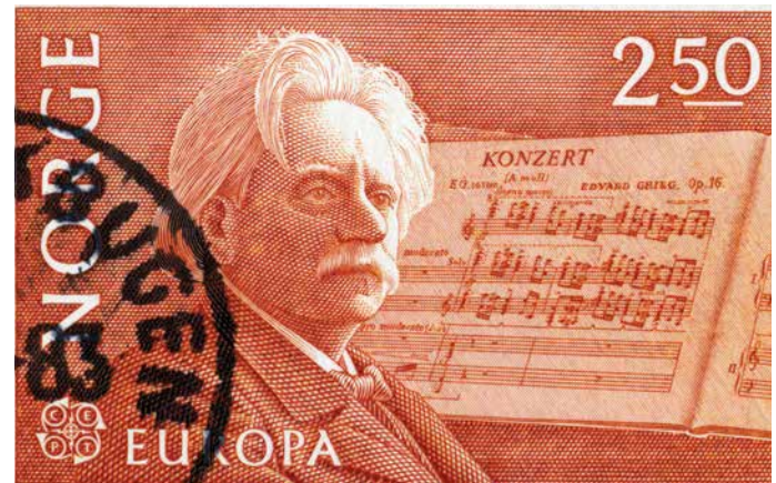
Edvard Grieg (1843 – 1907)