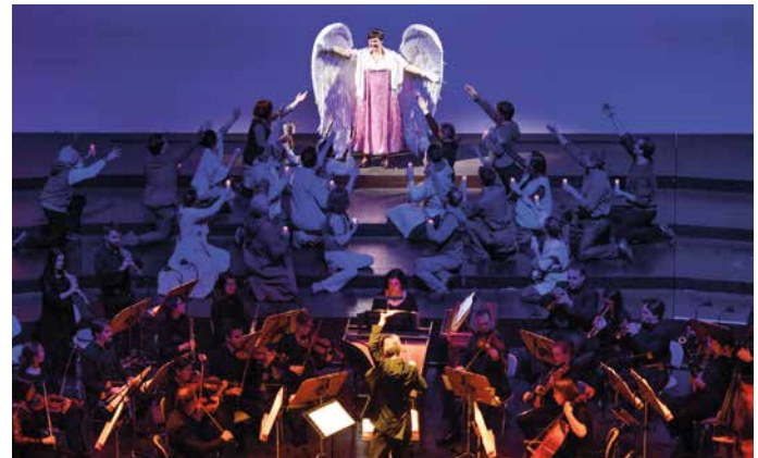
Vokalakademie Berlin