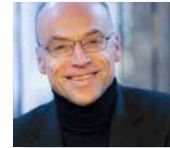
Johannes Skudlik © Jonathan Skudlik