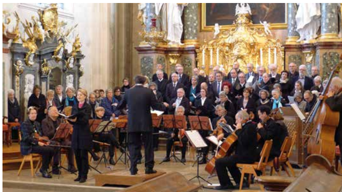
Bachkantate 2015

Aufführung: Sonntag, 14. Juni in St. Peter im Gottesdienst um 10 Uhr Proben und Vorträge: 12. bis 14. Juni 2020 in der Katholischen Akademie Freiburg